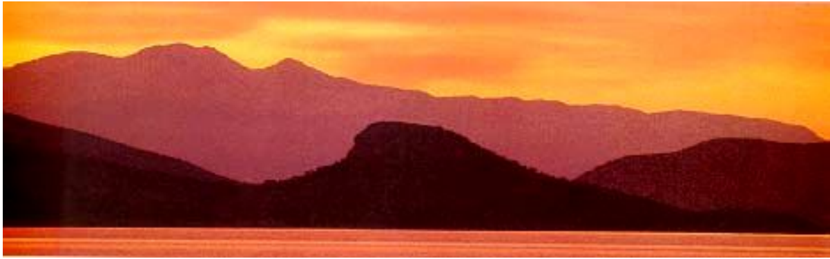
Bergkulissen bei Epidaurus