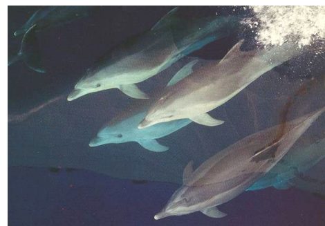
Freunde der Segler